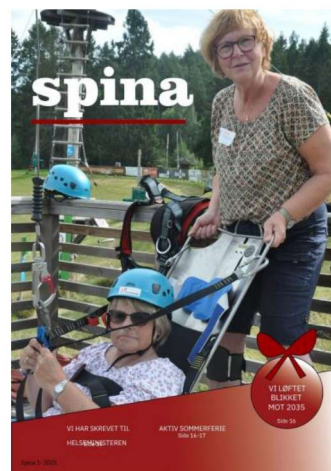
Bilde 4: Spina utgave nr 1 2025

Det ble i 2025 publisert én utgave av Spina. Styreleder og daglig leder var ansvarlig for innhold og publisering.