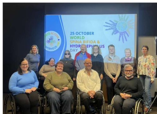
Bilde 2: Gruppebilde storstyremøte 2025

Arbeid for aktivitet i alle fylkeslag er ett av tiltakene. Foreningen etterspurte personer til styrearbeid via sosiale medier og epost til medlemmer i fylkeslag uten aktivitet. Det resulterte i to henvendelser fra medlemmer i ett fylkeslag.