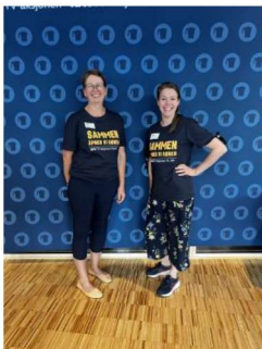
Bilde 5: Lansering av TV-aksjonen 2025

Atlas-alliansen hadde ansvaret for TV-aksjonen 2025 og foreningen deltok som tilsluttet organisasjon. Ansatte og flere av foreningens tillitsvalgte og frivillige bidro aktivt i forkant og under TV-aksjonen. Dette omfattet deltakelse i møter med informasjons- og formidlingsarbeid, samt bidrag i media som ukeblad og radio.