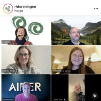
Bilde 3: Medlemmer i fag- og informasjonsutvalget

Utvalget hadde seks digitale møter i 2025. «Fag» ble inkludert som begrep i både navnet og i arbeidsområder.