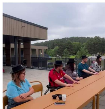
Bilde 6: Deltakere på "aktiv sommerferie 2025"

Det var totalt 14 deltakere og 8 ledsagere/hjelpere (inkludert leirledelse) som deltok.